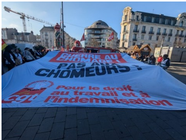
Guerre au chômage, pas aux chômeurs !