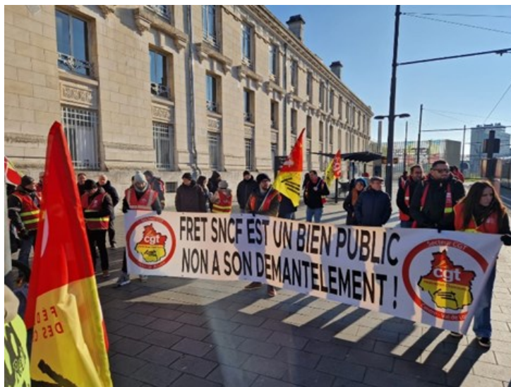
Les cheminots CGT dans la manif